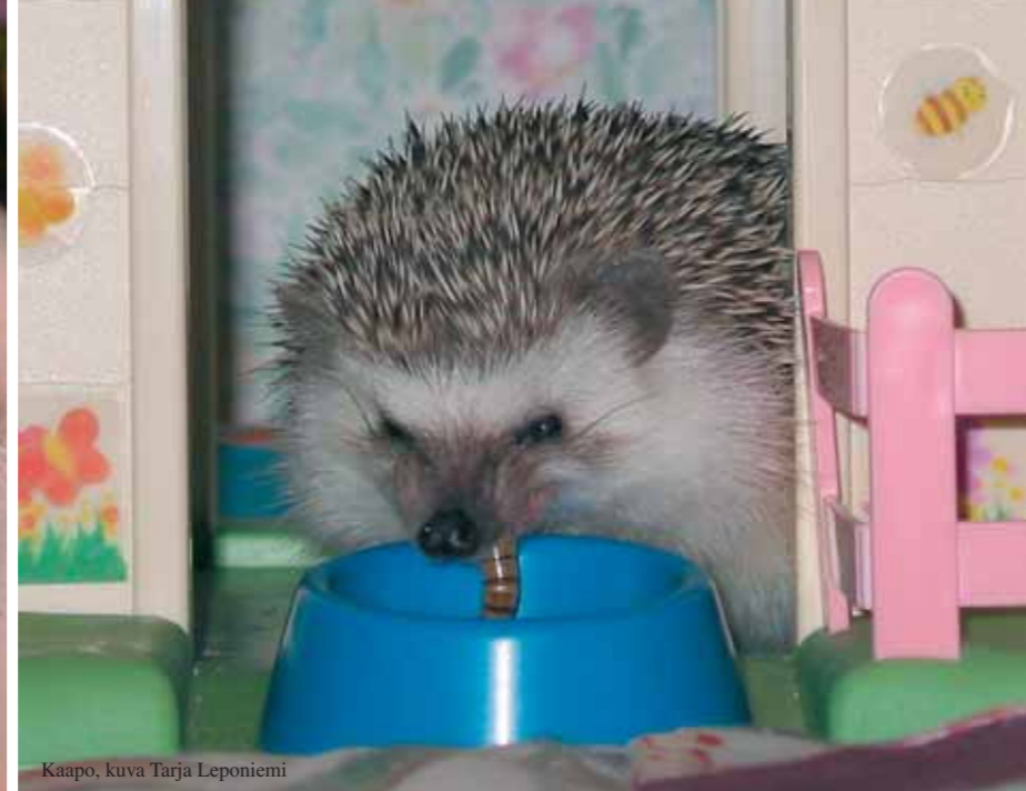
Auringonkehrän Onni