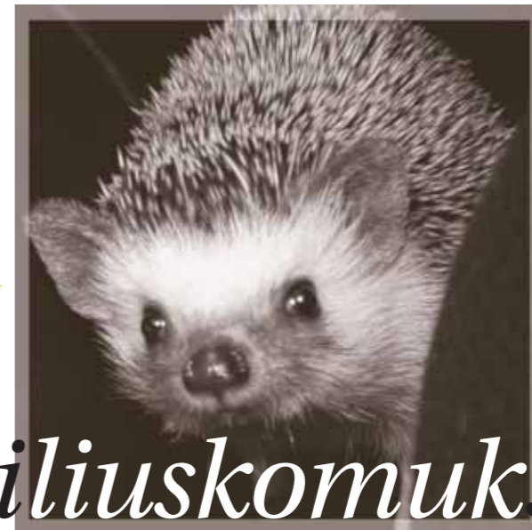
Kirjoittanut Marianne Ekholm Kuvassa liris