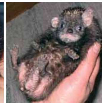
Showmies Esi-Isä om. Riku Kärnä