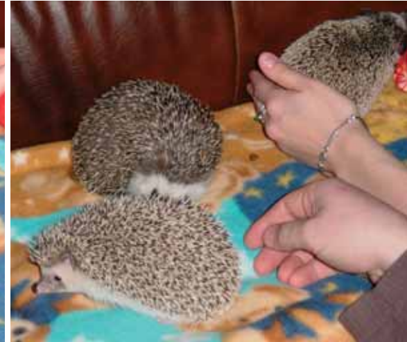
Siilitapaamisissa siilitien lisäksi toisiinsa tutustuivat myös siilit.